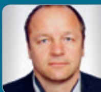
KommR Ing. Schöbinger Baumeister Allg. beeid. u. gerichtl. zert. SV