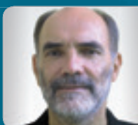
Sen.-Rat DI Kirschner Leiter der Stabstelle MA 37 – Baupolizei